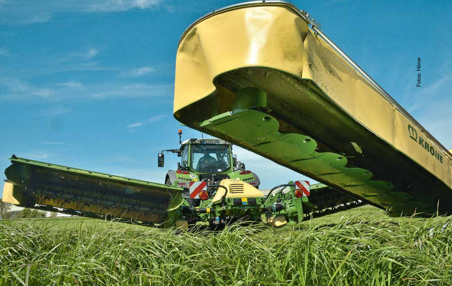
△ Gleiche Arbeitsbreite, aber schlankere Bauform: Ohne Aufbereiter bringt die Mähkombi ein deutlich geringeres Einsatzgewicht.

800 kg knapp eine halbe Tonne weniger als das F320CV (1 280 kg).