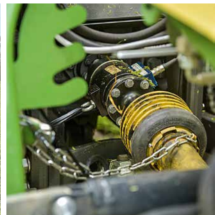
△ Links: Auf einigen Testpartellen kam ein Wender zum Einsatz. Seine Arbeitsbreite passte zu der der Mähkombis. Rechts: Mit Drehmomentmessnarben haben wir die Leistung gemessen.