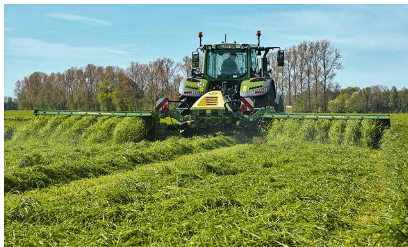
△ Den Einsatz des Aufbereiters erkennt man bereits beim Mähen mehr als deutlich. Das Futter wird intensiv geknickt (rechts) und kann so schneller abtrocknen. Ohne Aufbereiter (links) liegen die Grashalme nahezu unberührt in der Reihe.